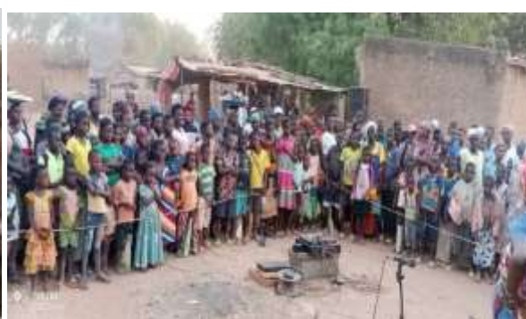
Aperçu du public