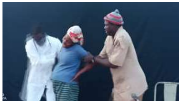
Quelques scènes de la représentation