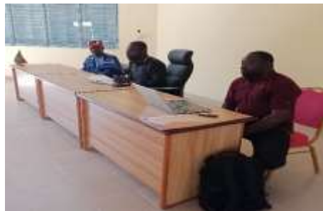
Aperçu des participants aux rencontres de cadrage