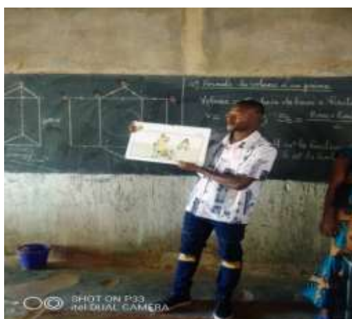
Quelques images des causeries